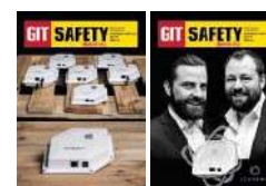
Beispiele für Innentitel

Preis für Schaltung von drei Anzeigen: jeweils Einzelpreise pro Anzeige bei Beauftragung von drei Anzeigen in einem Paket, Preise enthalten 30% Rabatt, Cent-Preise kaufmännisch gerundet – die tatsächlichen Preise können daher geringfügig abweichen